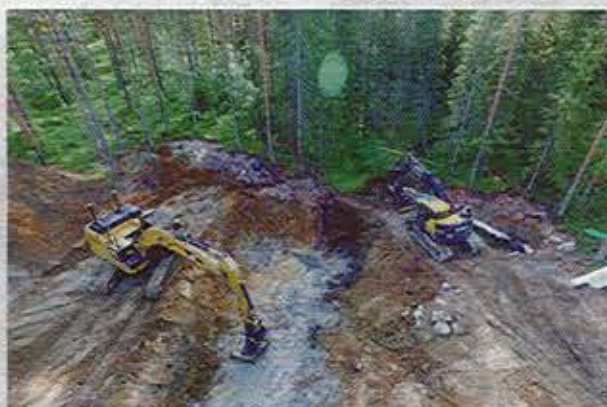
BYGGNADSRARBETE. Vägen stängs av på fredagskvällen och öppnas i början av veckan, allt för att påverka trafiken så lite som möjligt.