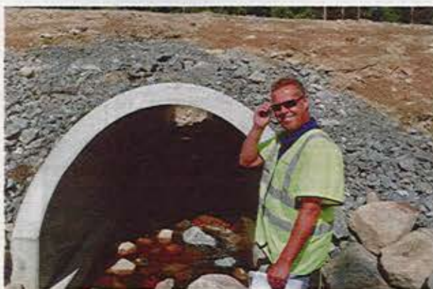
SMART KONSTRUKTION. Bantrumman underlättar för fiskar att ta sig upp såväl ner för bäcken med sin smarta konstruktion.